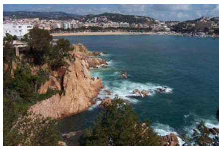
San feliu de guixols

Découvrez un site magique dans une région d'exception.